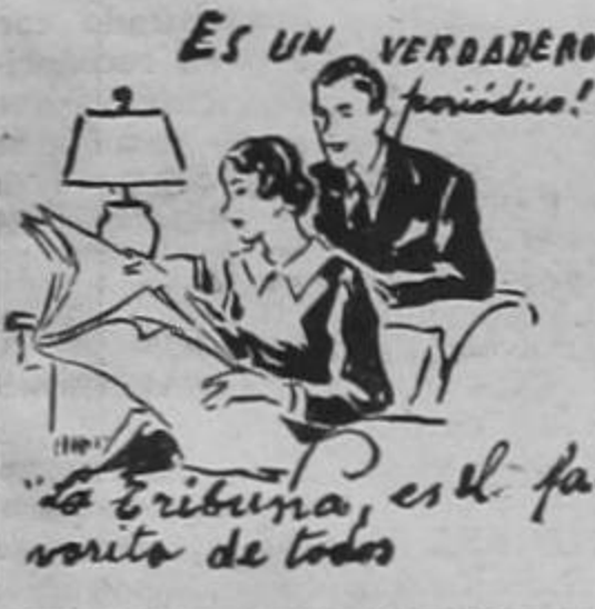
ES UN VERDADERO "tribuna", es el favorito de todos

GINEBRA, 1º — El gobierno de Finlandia ha presentado una protesta contra el Soviet, notificando a la Liga de Naciones que los aviones rusos violaron la neutralidad de la zona de las islas Aaland, violación que constituye una amenaza para todos los países signatarios de la convención ginebrina de 1921.