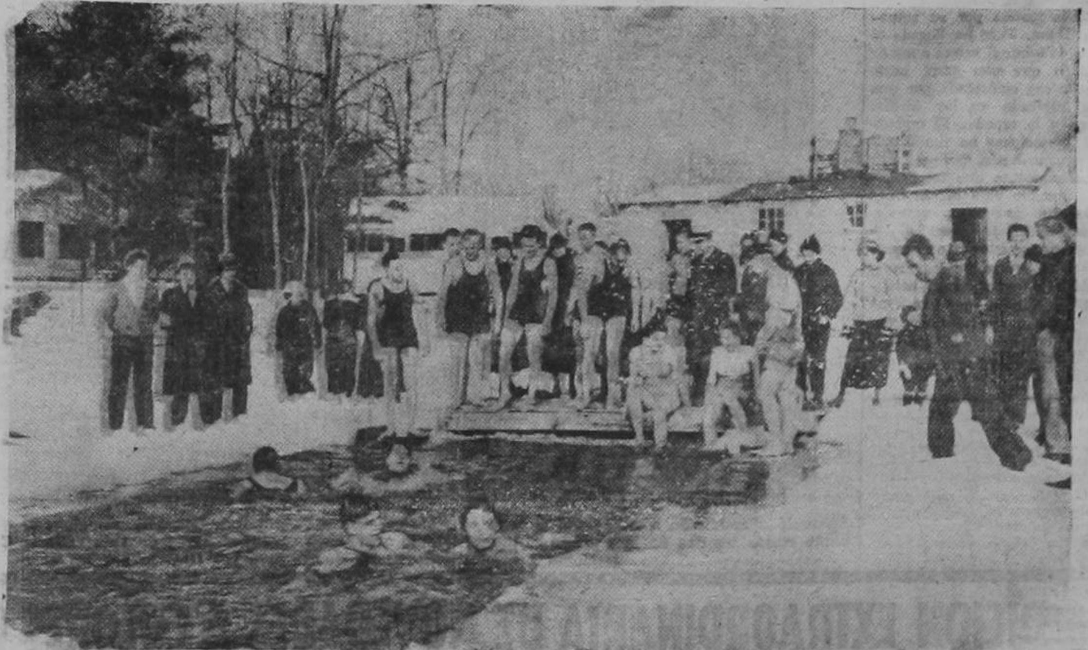
Estos nadadores escandinavos, residentes de Rosendale, Nueva York, hicieron un agujero en la nieve del lago Williams, de manera que pudieran usarlo como piscina en unas competencias natorias. Lo recaudado de los espectadores fué a engrasar el fondo de Auxilio a Finlandia.