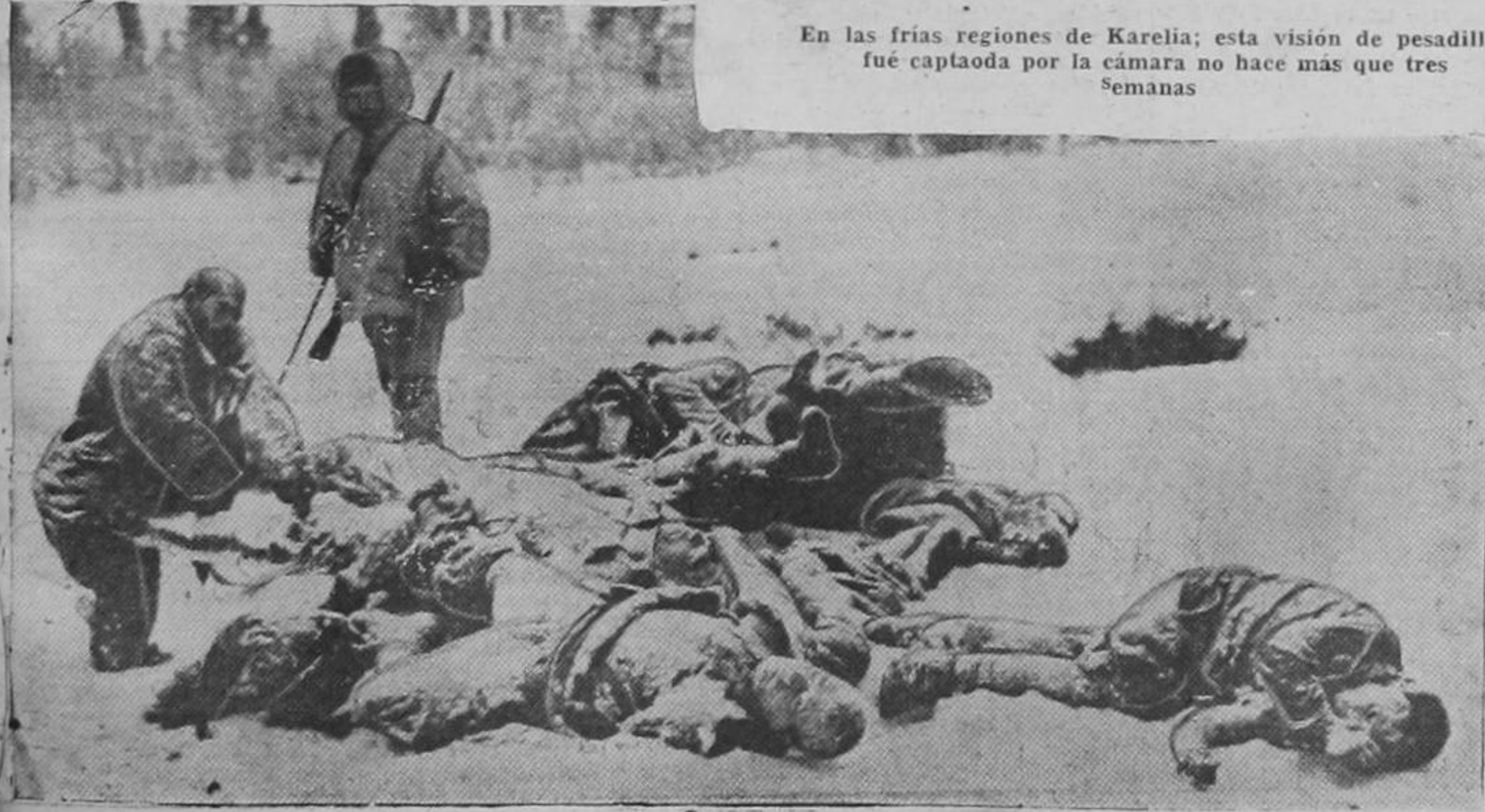
En las frías regiones de Karelia; esta visión de pesadilla fué captada por la cámara no hace más que tres Semanas

A la una y media de la madrugada se declaró un violento incendio que bien pronto acabó con el nuevo y moderno edificio, del que sólo quedaron las paredes de concreto